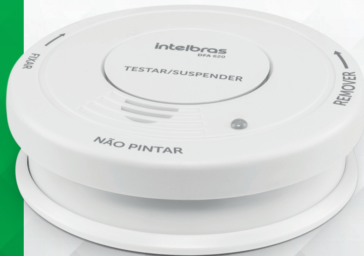
Detector de Fumaça Autônomo